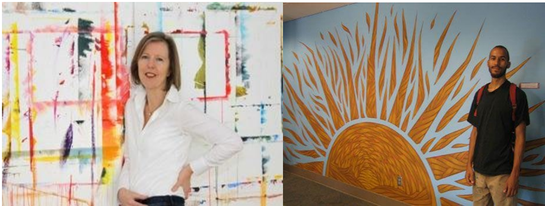
Рис. 7, 8. Виставка робіт пацієнтів лікарні Psychiatric University Hospital of the Charite' at St. Hedwig (США).

Цілюще та безпечне середовище перебування хворих у психіатричних закладах є найважливішим питанням в Європейських країнах. Для створення таких умов у країнах ЄС при проектуванні нових або реконструкції старих закладів охорони психічного здоров'я особливу увагу приділяють гігієнічним аспектам проектування, будівництва і оздоблення медичних споруд.