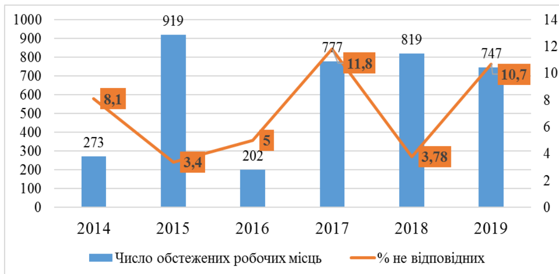
Рисунок 5 - Кількість обстежених робочих місць в лікувально-профілактичних закладах Вінницької області за 2014-2019 рр. та кількість вимірів штучного освітлення, що не відповідала нормативним вимогам за ДСП №173-96, ДБН В.2.5.-28:2018 (у %)