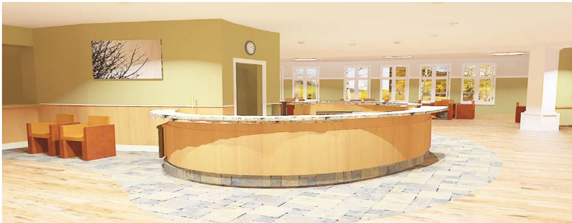
Рисунок 2 - Вигляд посту чергової медичної сестри у закладі охорони здоров'я психіатричного профілю США.

На Рис.2 показаний приклад архітектурно-планувальних рішень з облаштування посту чергової медичної сестри у закладі охорони здоров'я психіатричного профілю із застосуванням оздоблюваних матеріалів кольорової гама, яка створює умови житлового середовища.