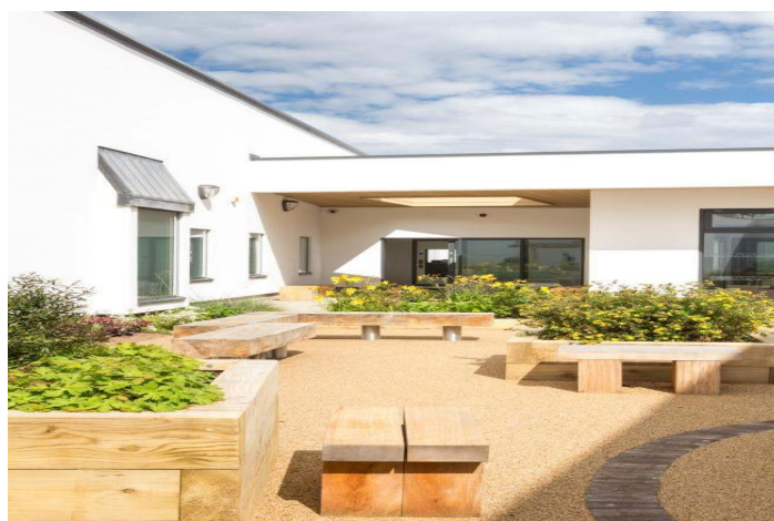
Рисунок 4 - Вид відкритого внутрішнього дворику психіатричної лікарні Шеппард-Пратта для прогулянок пацієнтів на свіжому повітрі (США, штат Меріленд, м. Таусон).

Варто також при проектуванні спеціалізованих відділень перейняти закордонний досвід вибору кольорової гами для опорядження палат з урахуванням віку пацієнтів. Світові дизайнери з цією метою використовують за основу праці Рудольфа Штейнера про значення кольорів у терапії хворих. Найбільш сприятливими для лікування пацієнтів з психічними розладами він вважав блакитний і рожевий. Зокрема, доведено, що правильна колористика палати і відділення загалом зменшує прояви прихованої ворожнечі та депресії. Рожевий колір, наприклад, заспокоює і розслаблює; кольори на підлозі допомагають хворим орієнтуватись у різних за призначенням групах приміщень. Досить часто практикується прикрашання стін закладу художніми роботами самих пацієнтів (арт-терапія), при цьому хворий не тільки