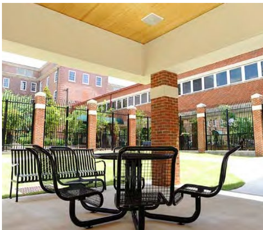
Рисунок 3 - Вид закріпленого підвір'я для відпочинку пацієнтів психіатричної лікарні на свіжому повітрі (США, штат Алабама, м. Тускалуза).