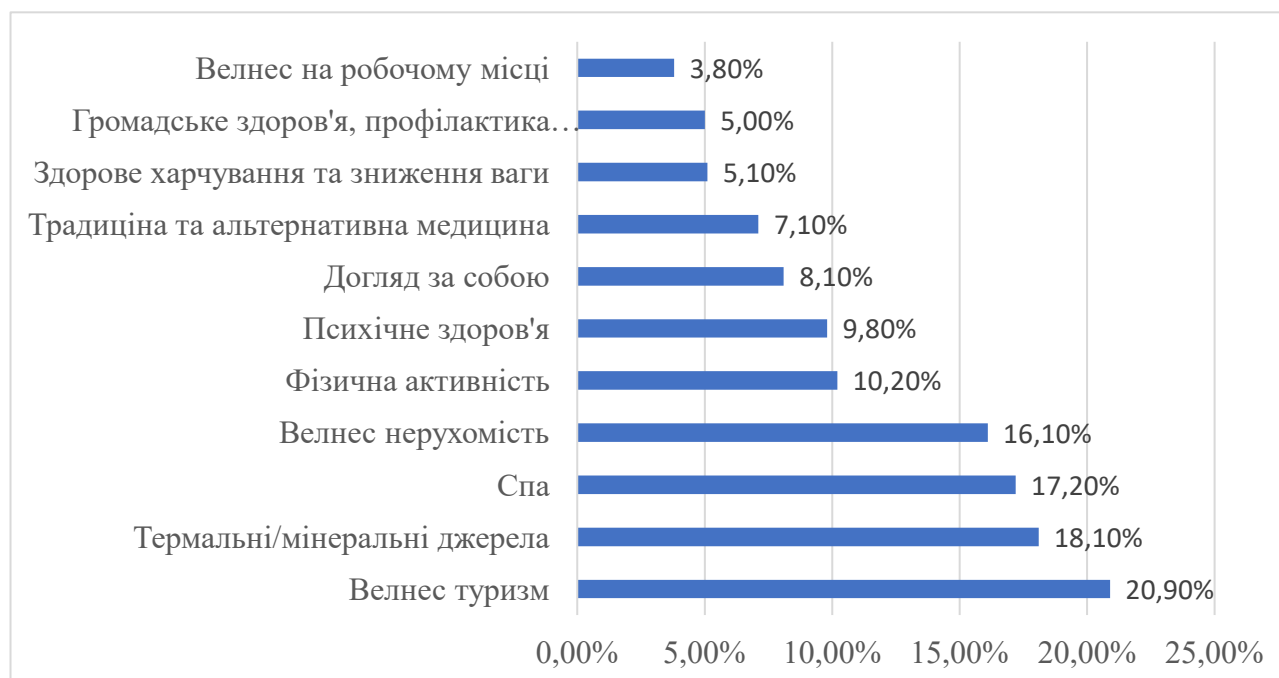
Рисунок 1 – Прогнозні показники відновлення складових індустрії оздоровлення після пандемії.

За прогнозами експертів Інституту глобального оздоровлення, ці сектори індустрії оздоровлення відновляться якнайшвидше [3; 4]. Прогнозні показники відновлення наведено на рис. 1.