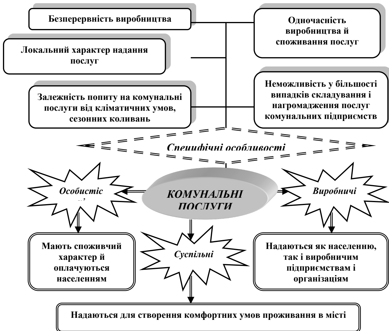
Рисунок 2 – Види та специфіка комунальних послуг (складено автором на підставі [4])

господарства дозволяє систематизувати види та специфіку комунальних послуг, а також класифікацію комунальних підприємств у вигляді схем (рисунки 2, 3).