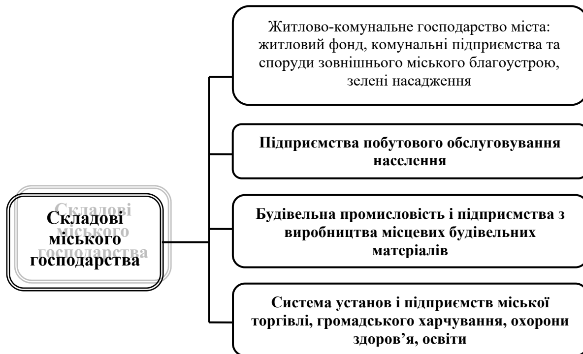
Рисунок 1 - Складові міського господарства (складено автором на підставі [2])

представимо у вигляді схеми (рисунок 1).