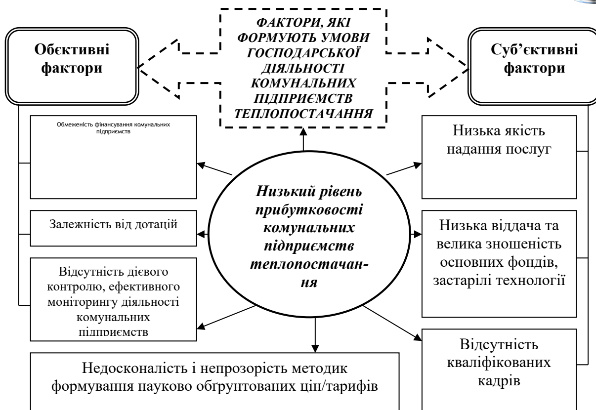
Рисунок 3 – Схема факторів впливу на господарську діяльність комунальних підприємств теплопостачання (складено автором на підставі [11 - 15])

Комунальна теплоенергетика області розвивалась за залишковим принципом, а надзвичайно високі ціни на енергоносії ще більше погіршили її стан. Специфікою діяльності підприємств, які надають послуги у сфері теплопостачання населенню та об'єктам соціальної сфери в області, є те, що послуги надаються незалежно від стану платежів за них окремими споживачами в умовах систематичного зростання цін на енергоносії. Наслідком цього є критичний фінансовий стан підприємств комунальної теплоенергетики області.