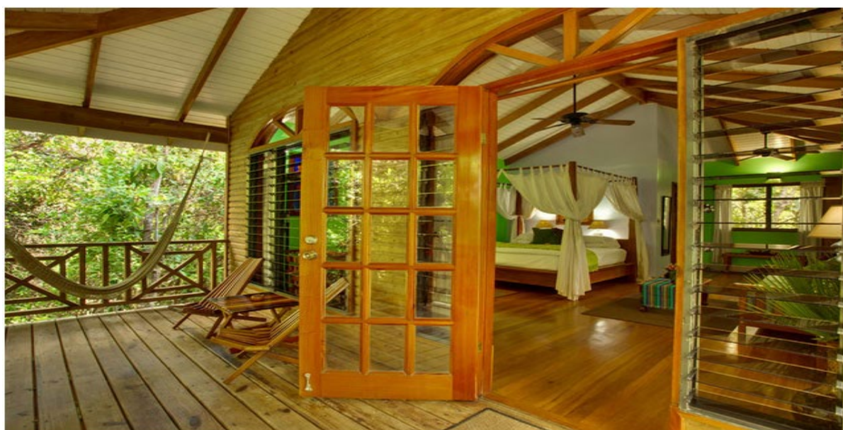
Рисунок 20 - Hamanasi Adventure and Dive Resort (Беліз)

Незвичайний готель розташований в гілках дерев на узбережжі Белізу. У люксових «номерах-гніздах» є відкриті джакузі, міні-кухня та простора вітальня. Будинки та меблі в номерах виконані з рідкісних порід дерев, які ростуть у лісах Белізу. Крім того, в цих лісах велика різноманітність птахів і поруч розташований другий за величиною бар'єрний риф в світі (Рис.20) [15].