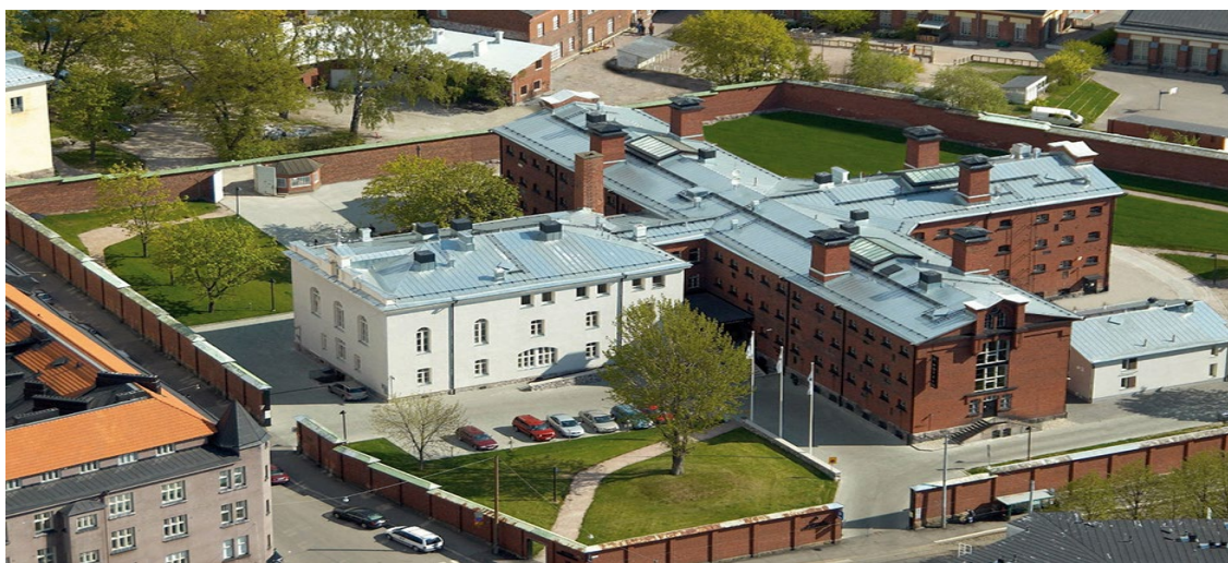
Рисунок 6 - Hotel Katajanokka (Гельсінкі, Фінляндія)

Окружна в'язниця Гельсінкі (Фінляндія), яка розташована в районі Катаянokka, використовувалася за призначенням з 1837-го по 2002 рік. Вона, як і більшість будинків у фінській столиці, була побудована за указом Миколи I. Спочатку тут було всього 12 камер і дві кімнати для охорони. В останні роки заклад працював як слідча в'язниця, тобто підозрювані чекали в ній суду. Через п'ять років після ліквідації в'язниці в будівлі був відкритий готель. Сьогодні в Hotel Katajanokka, який володіє чотирма типами кімнат, можна зупинитися за 100 євро на добу. У вартість проживання входить сніданок, а деякі кімнати обладнані власною сауною. Також, в готелі працює ресторан a la carte, а в теплу пору року можна пообідати на відкритій веранді (Рис.6).