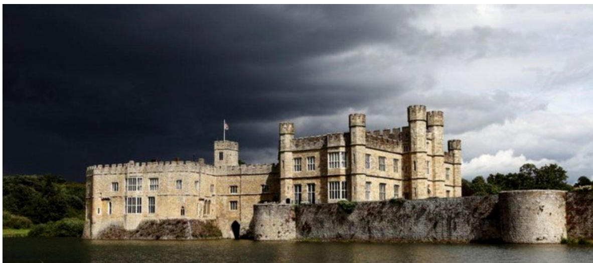
Рисунок 3 - Замково-парковий комплекс Лідс (Англія)

Замок Ешфорд в Ірландії був закладений в XIII столітті на місці монастиря в графстві Голвей. З нього відкривається прекрасна панорама на затуманене озеро Лох-Корріб з численними острівцями. Тому, проживаючи в готелі, можна орендувати човен та роздивитись безлюдні острови зблизька. В замку облаштовані сучасні зручності для комфортного відпочинку, тут є навіть SPA-салон, а поряд працює кінотеатр. Замок Ешфорд - це 5-зірковий готель класу люкс, він посідає одне з провідних місць у рейтингу Всесвітньої організації готелів. Крім будівлі самого замку, тут також є оранжерея та збережено величезний парк, яким можна гуляти годинами (Рис.4).