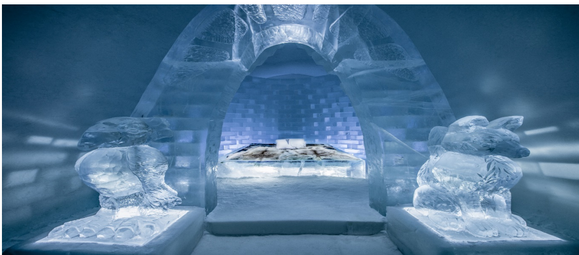
Рисунок 15 - Крижаний готель Icehotel (Швеція)

якій можна взяти шлюб, і Крижаний бар – улюблене місце всіх гостей і туристів, адже Icehotel можна відвідати й не зупиняючись там. Такі екскурсії, іноді суміщені з катанням на снігоходах, організовує чимало туристичних компаній. Сам готель також пропонує своїм гостям різноманітні послуги та розваги: катання на лижах, на собачих запряжках, поїздки за північним сьйвом. У готельний сервіс входить надання гостям теплового одягу – комбінезонів, взуття, рукавиць, шапок-балаклав, а для ночівлі – найтепліших пухових спальників (Рис.15).