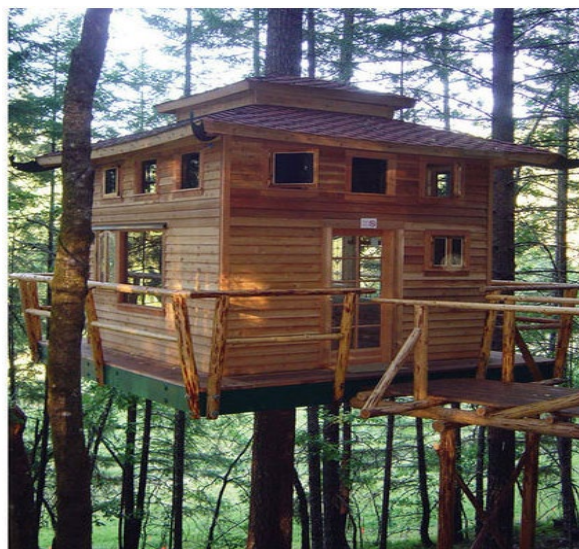
Рисунок 19 - Vertical Horizons, штат Орегон (США)

Незвичайний готель розташований в гілках дерев на узбережжі Белізу. У люксових «номерах-гніздах» є відкриті джакузі, міні-кухня та простора вітальня. Будинки та меблі в номерах виконані з рідкісних порід дерев, які ростуть у лісах Белізу. Крім того, в цих лісах велика різноманітність птахів і поруч розташований другий за величиною бар'єрний риф в світі (Рис.20) [15].