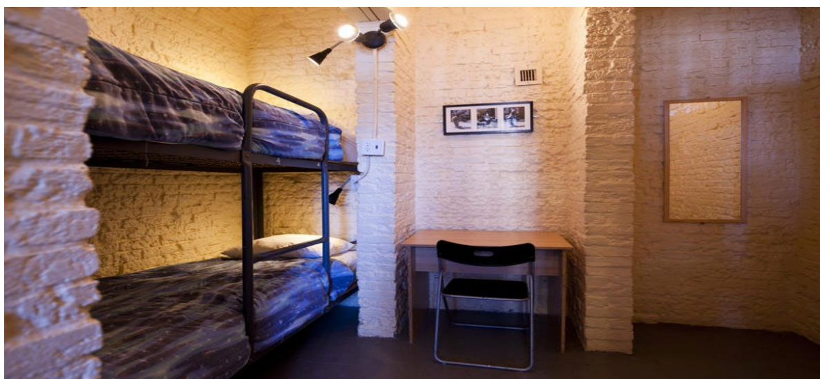
Рисунок 10 - Ottawa Jail Hostel (Оттава, Канада)

В'язниця в Оттаві (Канада) пропрацювала всього 10 років – з 1962-го по 1972 рік. Однак вона встигла прославитися як одна з найбільш жорстоких у країні. Ув'язнені тут містилися в камерах без опалення і каналізації. Деякі відвідувачі стверджують, що неодноразово зустрічали привидів ув'язнених.