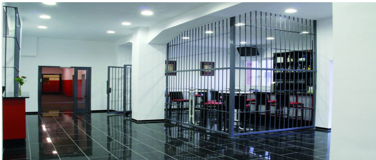
Рисунок 9 - Alcatraz Hotel (Кайзерслаутерн, Німеччина)

Тюрма тут працювала з 1867-го по 2002 рік. Зараз будівлю перебудовано, у ній розташовується 56 номерів. Є як цілком звичайні кімнати, так і щось дуже близьке до камер з загальними туалетами, закритими вікнами і «тюремними сніданками» (Рис.9).