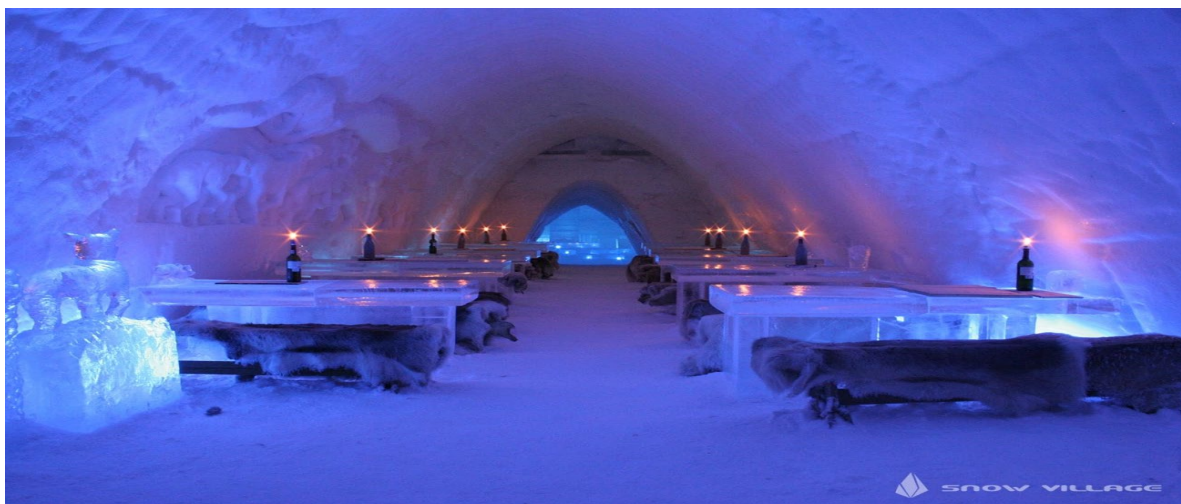
Рисунок 16 – Крижаний готель SnowVillage Snow Hotel (Лапландія)

Не менш популярні екоготелі на деревах - це унікальний тип готелів, які розташовані високо в деревах або на платформах, і часто пропонують незвичайний та екологічно чистий досвід перебування туристів. Ці готелі зазвичай спроектовані так, щоб зберігати природні ландшафти та дерева, а також пропонувати гостям ближчий контакт із природою. Головний принцип екоготелів на деревах - збереження природи. Ці готелі спроектовані з урахуванням сталого розвитку, використовуючи енергоефективні технології та екологічно чисті матеріали. Екоготелі зазвичай розташовані в природних місцях, таких як ліси, гори, побережжя або інші живописні ділянки. Це створює унікальну атмосферу та дозволяє гостям поглибитися у природному середовищі [7-14]. Багато екоготелів використовують спеціальні конструкції на деревах або платформи для розташування номерів. Це може включати дерев'яні будівлі, бунгало або наметові спальні, розташовані на високих стовпах. Екоготелі на деревах сприяють розвитку екотуризму, пропонуючи гостям можливість долучитися до екскурсій, екологічних заходів та вивчення природних процесів. Багато екоготелів вживають заходів для збереження біорізноманіття та забезпечення екологічної стійкості, намагаючись не впливати на природну екосистему. Засновані на концепції ексклюзивності, екоготелі на деревах пропонують гостям незабутні враження, надаючи їм можливість перебувати в нестандартних та екзотичних умовах.