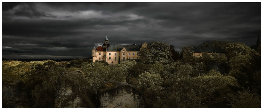
Рисунок 1 - Замок Груба Скала (Чехія)

Прикладом може стати замок Груба Скала, який розташовується в мальовничій місцевості на півночі Чехії. Він був закладений в XIV столітті на неприступній скелі, а вже пізніше перебудований в ренесансному стилі. Від замку відкриваються розкішні панорами на навколишні ліси, а в погожу погоду тут навіть видно руїни фортеці Троски, що віддалена від замку приблизно на 5 км. Крім готелю, в замку працює СПА-комплекс, лазня, сауна та масажний кабінет. А охочі можуть постріляти з лука та пройти канатною дорогою (Рис.1).