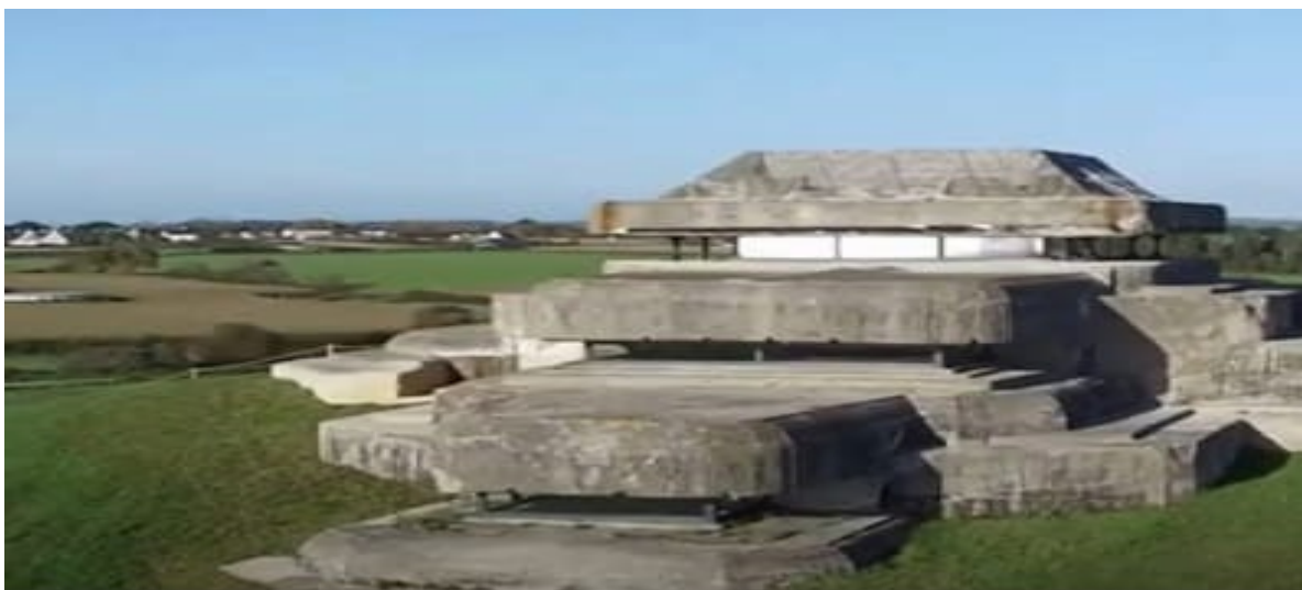
Рисунок 11 – Готель - бункер L-479 (Франція)

У німецькому місті Гамбурзі колишній нацистський бункер St Pauli переобладнали на готель. Готель знаходиться на вершині бункера, де розташовано багаторівневий парк. У ньому 136 номерів, бункер збудований полоненими робітниками для захисту жителів від повітряного бомбардування під час Другої світової війни. Він був розрахований на 18 тисяч осіб. Споруда має широкі входи, тому її називають «високий бункер». Будівля у формі замка шириною близько 75 метрів і висотою 35 метрів. Наприкінці Другої світової війни у місті було збудовано понад 1000 бункерів. До наших днів із них збереглися близько 650 (Рис.12) [4].