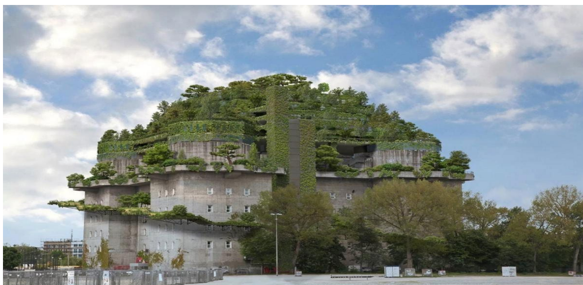
Рисунок 12 – Готель - бункер St Pauli (Німеччина)

У німецькому місті Гамбурзі колишній нацистський бункер St Pauli переобладнали на готель. Готель знаходиться на вершині бункера, де розташовано багаторівневий парк. У ньому 136 номерів, бункер збудований полоненими робітниками для захисту жителів від повітряного бомбардування під час Другої світової війни. Він був розрахований на 18 тисяч осіб. Споруда має широкі входи, тому її називають «високий бункер». Будівля у формі замка шириною близько 75 метрів і висотою 35 метрів. Наприкінці Другої світової війни у місті було збудовано понад 1000 бункерів. До наших днів із них збереглися близько 650 (Рис.12) [4].