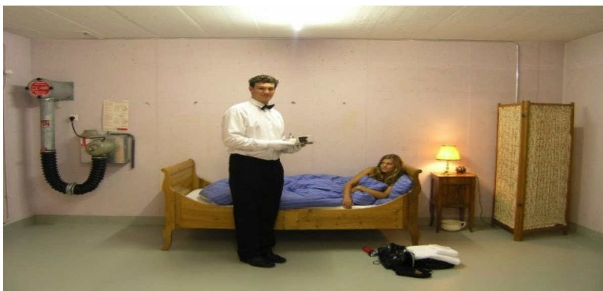
Рисунок 13 – Готель-бункер Null Stern Hotel (Швейцарія)

Ще одним прикладом вдалого використання старих речей є перший у світі нульовий зірковий готель Null Stern Hotel, знаходиться він у місті Тіофен, що у Швейцарії, в основу його було взято занепавший бункер. У ньому не має якихось особливих послуг, окрім ліжка, тумби, світильника, загальної ванни, більше того, тут навіть немає вікон, а стіни автори даного проєкту залишили недоторканими у всій своїй красі (бетонні та ще й неприховані труби). Null Stern Hotel був номінований на кращу інновацію року на Всесвітніх Hospitality Awards (2009), а у 2010 році він був зарахованим до списку 100 кращих готелів Європи (Рис. 13) [5].