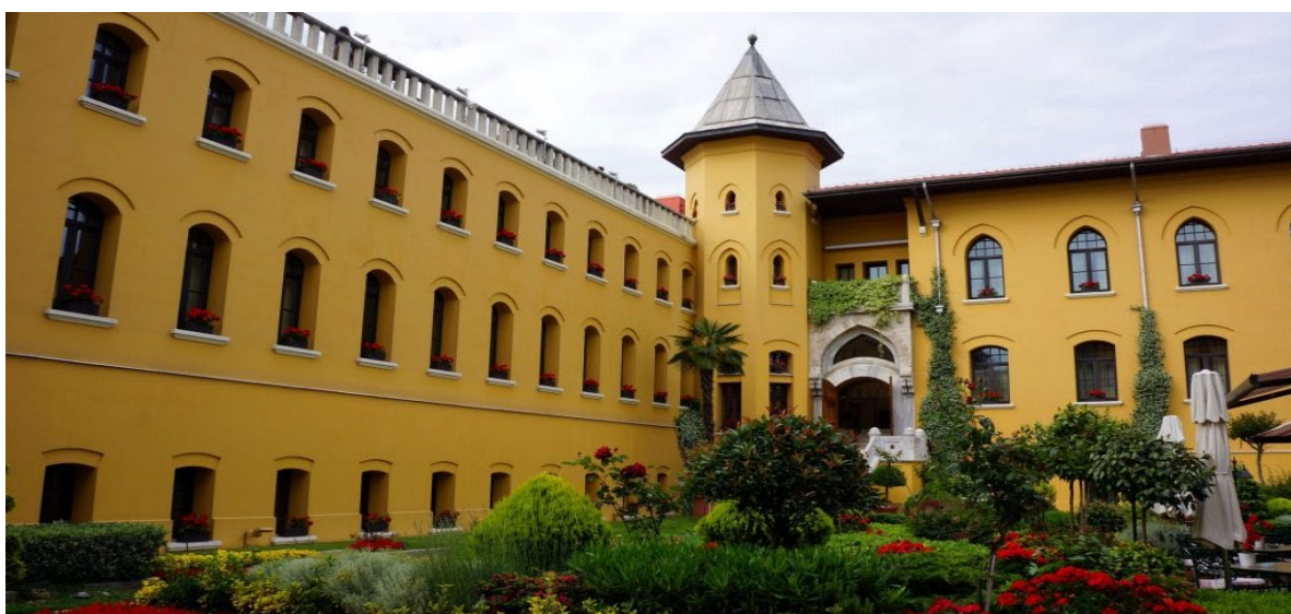
Рисунок 8 - Four Seasons Sultanahmet (Стамбул, Туреччина)

Мало хто може впізнати в одному з найшикарніших стамбульських готелів колишню в'язницю. Проте виправна установа розташовувалася в цій будівлі на початку ХХ століття. Про ті часи нагадують лише дерев'яні двері, що ведуть у вестибюль готелю, і гравюри в холі, на яких відображені імена колишніх ув'язнених (Рис.8).