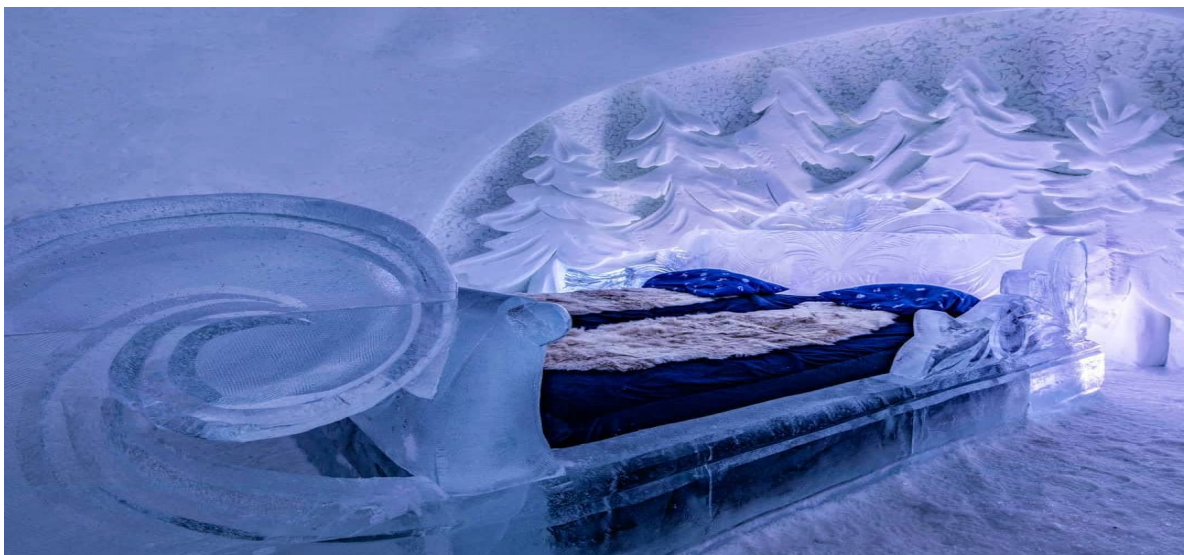
Рисунок 14 – Крижаний готель Snowhotel Kirkenes (Норвегія)

щороку запрошують найліпших майстрів з фестивалю крижаних скульптур у китайському Харбіні, аби ті наново відбудували і декорували споруду. Кожен із 20 номерів-люкс площею 5 кв. метрів має індивідуальний дизайн і оздоблений скульптурами зі снігу та льоду. Загальна ванна кімната є в сусідній будівлі. На час перебування у крижаному готелі гості отримують термопокривала і пухові спальники, а заодно і теплий одяг для екскурсій і розваг, яких пропонується чимало: це і ловля королівських крабів, і сафари на собачих запряжках, і вечеря в ресторані, влаштованому у традиційному скандинавському наметі –«лавву», біля якого гостей зустрічає живий олень, і вечірня поїздка за північним сяйвом на Експресі Аврора (Рис.14).