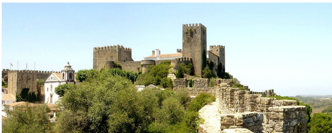
Рисунок 5 - Замок Обідуш (Португалія)

з аналогічною назвою. Вважається, що спочатку на місці сучасної твердині були стародавні римські лазні, а замок збудували в XII столітті. Згодом його укріпили фортечними мурами, які оточують твердиню і нині. Однак, після XV століття фортеця використовувалась переважно як місце відпочинку португальських можновладців. Монархи любили проводити тут святкування та весілля, оскільки Обідуш був розташований недалеко від Лісабона. Нині в замкові, окрім атракцій історичної тематики та ресторанів, розташовується готель на 17 кімнат (Рис. 5) [1].