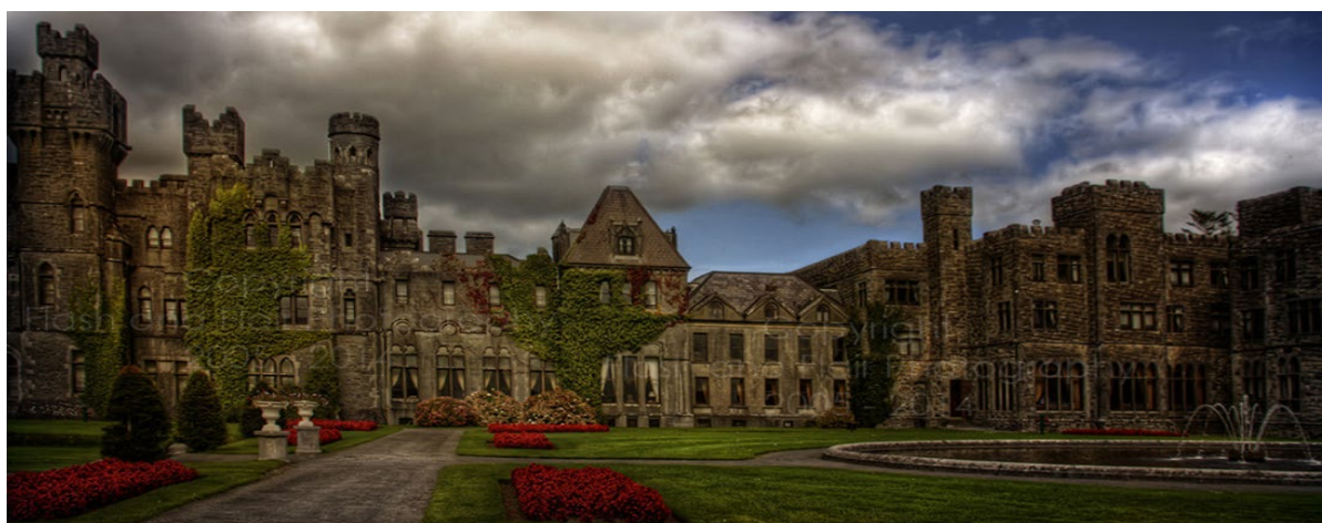
Рисунок 4 - Замок Ешфорд (Ірландія)

Замок Ешфорд в Ірландії був закладений в XIII столітті на місці монастиря в графстві Голвей. З нього відкривається прекрасна панорама на затуманене озеро Лох-Корріб з численними острівцями. Тому, проживаючи в готелі, можна орендувати човен та роздивитись безлюдні острови зблизька. В замку облаштовані сучасні зручності для комфортного відпочинку, тут є навіть SPA-салон, а поряд працює кінотеатр. Замок Ешфорд - це 5-зірковий готель класу люкс, він посідає одне з провідних місць у рейтингу Всесвітньої організації готелів. Крім будівлі самого замку, тут також є оранжерея та збережено величезний парк, яким можна гуляти годинами (Рис.4).