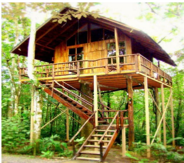
Рисунок 18 – Екоготель Tree Houses Hotel, (Коста-Ріка)