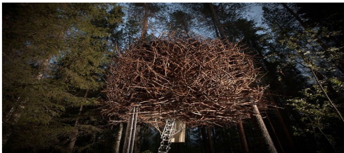
Рисунок 17 – Готель на деревах Treehotel (Швеція)

У шведському лісі туристам пропонується кілька варіантів «гнізд-бунгало» для проживання. Один з номерів зовні оброблений переплетеними гілками дерев, що нагадують пташине гніздо. Не дивлячись на таку обробку усередині інтер'єр номера цілком відповідає сучасному готельному люксу. У номері є двоспальне ліжко, ванна кімната й тераса (Рис.17).