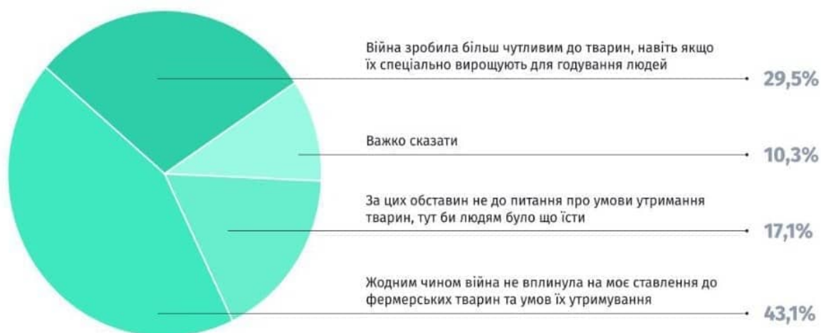
Рисунок 2 Ставлення до фермерських тварин та умов їх утримання

Як змінилось ваше ставлення до фермерських тварин та умов їх утримання від початку повномасштабного вторгнення росії в україну?