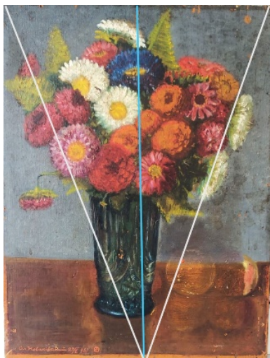
Рисунок 3. Композиційний поділ експертної роботи

Ще одну контрастну групу складають плями холодної та теплої кольорової гама. Тепла – букет з квітами та столешниця на якій стоїть вазон. Холодна – вазон й тло. В композиції відбувається щось на зразок чергування теплих й холодних плям.