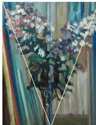
Рисунок 4. Композиційний поділ аналогової роботи. (Додаток 5)

Стилістичні відмінності. Аналіз зображення показує що стилістичні ознаки характерні для живописної творчості Новаківського його зрілого періоду, періоду художника - визнаного майстра живопису в «нашій» роботі практично не виявленні. Відсутній динамізм, експресія, швидкість малярського мазка який ми звикли бачити у творах художника з музейних збірок. В тому нічого дивного немає, оскільки в музеях України взагалі не так вже багато зберігається робіт художника й в край мало творів які б можна було віднести до його раннього періоду, в т. ч. написаних в період навчання.