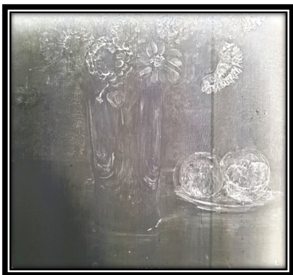
Рисунок 2. Рентгенівський знімок натюрморту