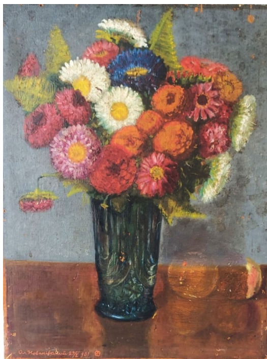
Рисунок 1. Новаківський О. Натюрморт з квітами. 1901 р. Дикта, олія, 44,6 x 34,28. Приватна збірка

лишається пошук нових невідомих картин його авторства, їх атрибуція та ідентифікація. Саме у приватних збірках України, Польщі, а також Америки й Канади знаходиться лєвова частка його робіт. Кожна віднайдена картина Новаківського це наукове відкриття яке безумовно розширює уявлення про його творчість, поповнює наукову базу дослідження й дає підґрунтя для нових досліджень та висновків.